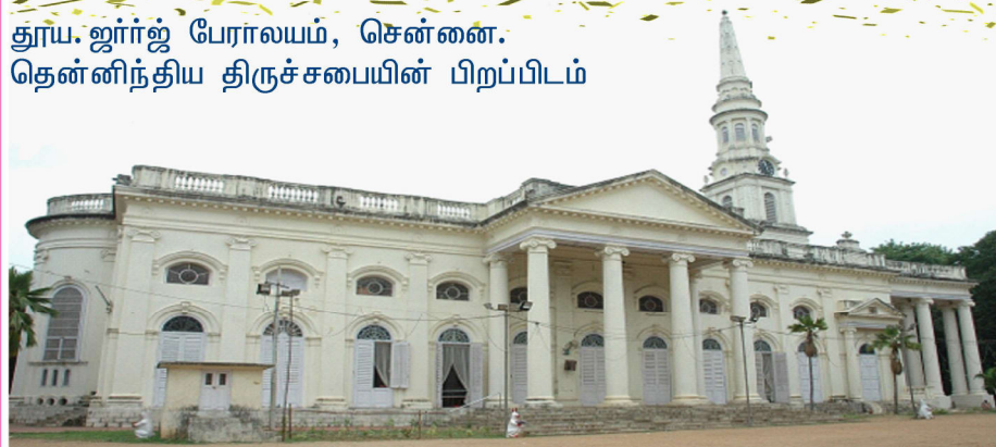
St. George's Cathedral - The birthplace of the CSI

தூய. ஜார்ஜ் பேராலயம், சென்னை. தென்னிந்திய திருச்சபையின் பிறப்பிடம்